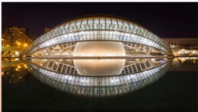
CIUDAD DE LAS ARTES Y LAS CIENCIAS (艺术科学城) 巴伦西亚