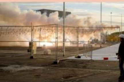
TODAYSART FESTIVAL 2014年开幕秀日光焰火作品 <MASCLET SCHEVENINGEN>现场

艺术与科学从未真正的分离。新科技的“未来”已经到来，更多艺术活动以多元的方式，发掘着艺术与技术结合之后所产生的新的创作可能性。艺术之美与科技之理，是我们时代浪潮中的两个面，希望在看到艺术表现的赏析中，得到对于科学认知的思辨。